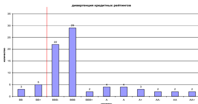
Рисунок 3. Дивергенция кредитных рейтингов по национальной шкале

Рейтинговое агентство поддерживает в актуальном состоянии 86 кредитных рейтингов банковских учреждений и их долговых инструментов. Из них 33 кредитных рейтинга имеют прогноз негативный, 11 находятся в контрольном списке, 3 кредитных рейтинга с позитивным прогнозом, 2 кредитных рейтинга с прогнозом «развивающийся».